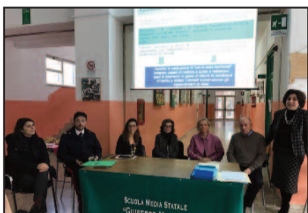
UN MOMENTO DELL'INCONTRO

Si è svolto giovedì 2 febbraio presso la Scuola Secondaria di Primo Grado "G. Mazzini", sede dell'Osservatorio di area Marsala-Petrosino, un incontro interistituzionale finalizzato alla condivisione di un piano di intervento per la lotta alla dispersione scolastica. L'incontro ha voluto dimostrare come l'attenzione al fenomeno della dispersione scolastica sia sempre viva e costante, e come obiettivo primario di tutti gli operatori del mondo della