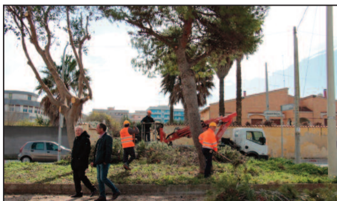
UN MOMENTO DEI LAVORI

Il quartiere popolare di Sappusi è interessato in questi giorni da un intervento di pulizia straordinaria programmato dall'amministrazione comunale di Marsala. "I nostri giardinieri sono al lavoro e hanno già iniziato a potare gli alberi e a scerbare e sistemare le aiuole - spiega il sindaco Di Girolamo -. Da domani agli operai del verde pubblico si aggiungeranno anche quelli dell'Energetika