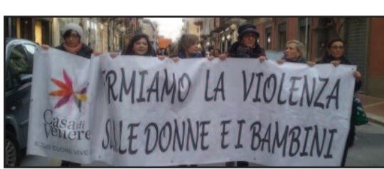
UN MOMENTO DEL CORTEO

È partito da viale Fazio, nei pressi della Stazione, il corteo contro la violenza sulle donne. Una marcia per "One Billion Rising", la campagna internazionale ideata da Eve Ensler. Ad abbracciare l'iniziativa e ad organizzare la manifestazione, il Centro Antiviolenza "La Casa di Venere" di Marsala. In realtà è stato un momento di aggregazione, per lottare uniti contro tutte le violenze e in particolare contro quelle nei confronti delle persone più deboli, anche nei confronti degli animali. A marciare con le operatrici del Centro Antiviolenza, anche le associazioni che operano sul territorio: Libera, C.I.F., Metamorfofi, Marhaba Onlus, M.O.I.C.A. O.I.P.A., La Casa Viola, con diversi giovani del progetto di partecipazione attiva "Giovanic@zia" e con alcuni migranti. In prima fila anche gli